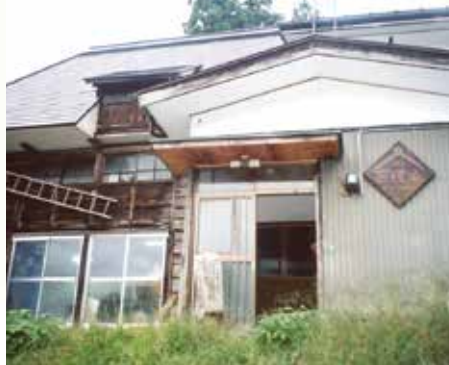
中越大地震の実話、紙芝居の上演 紙芝居①『走れメロス塩谷編』

時 10/4(火)～30日(日) 場 2F学習ゾーン 協 中越メモリアル回廊推進協議会