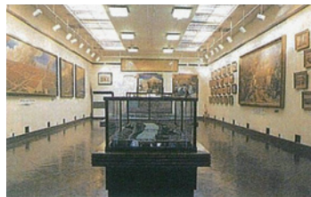
復興記念館展示場

関東大震災の惨事を長く後世に伝え、また焦土を復興させた当時の大事業を記念するため、昭和6年に建設されました。館内には震災及び戦災の記念遺品、当時の状況を伝える絵画、写真、図表などが展示されています。