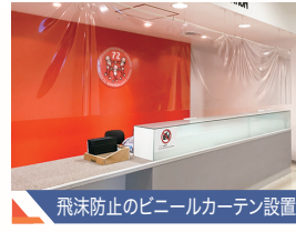
飛沫防止のビニールカーテン設置